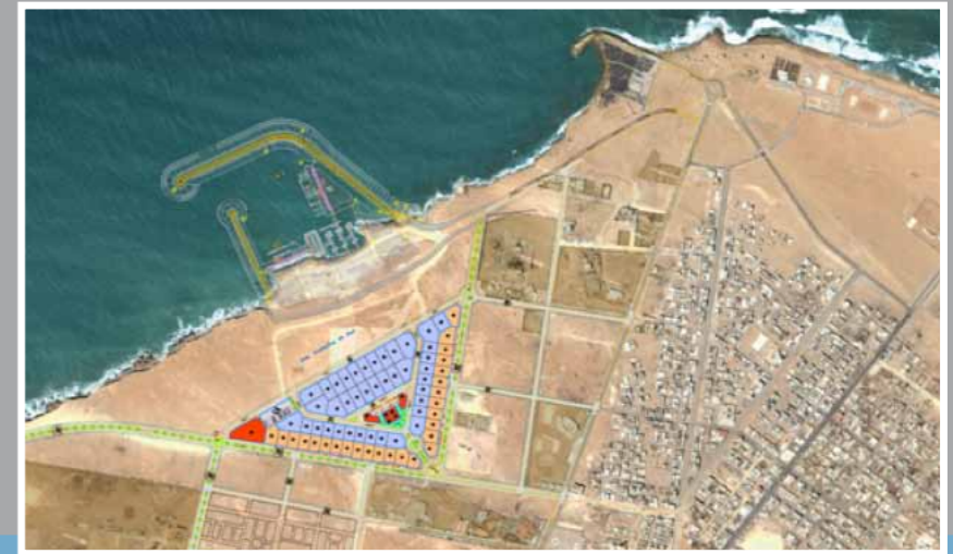
■ Industrie ■ Devanture & Commerce ■ Services & équipements